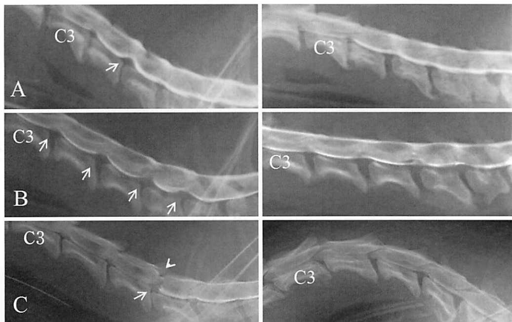
図1 脊椎造影X線検査による動的病変の検出